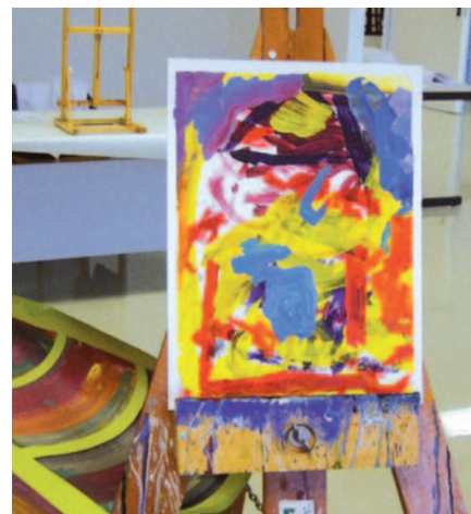
Das neue Kunstatelier Freistil wurde im März eröffnet.

Das Berufsbildungsprojekt Feinwerk wurde von der Bundesarbeitsgemeinschaft der Werkstätten für behinderte Menschen ausgezeichnet. Mit Feinwerk können wir in jedem Einzelfall belegen, dass Menschen mit hohem Bedarf auch jenseits der allgemeinbildenden Schule und jenseits der Werkstatt bildungsfähig sind und Lernfortschritte erzielen. Jeder Beschäftigte, der in