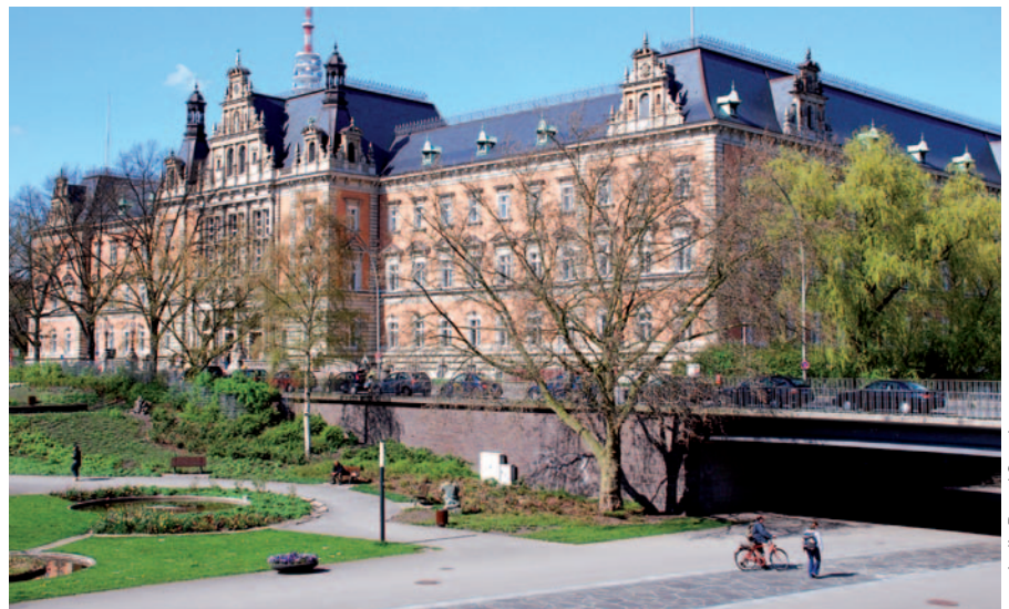
Strafjustizgebäude in Hamburg.

Zwei Filme des Vereins „Gefangene helfen Jugendlichen e.V.“ informieren über den Alltag im Gefängnis und die Zusammenarbeit mit Strafgefangenen aus „Santa Fu“ und Ju-